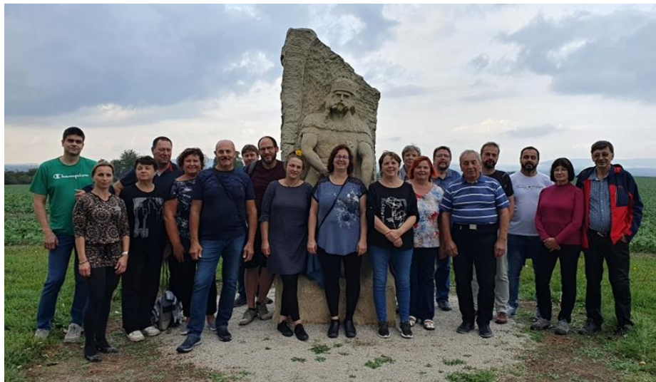
Členové Koněšínského ochotnického spolku a jejich blízcí na vrchu Náklo u Milotic

Koncem září se rozběhla příprava na novou divadelní sezonu. Abychom motivovali své členy a poděkovali za trpělivost i našim rodinným příslušníkům, vydali jsme se 30. 9. na malý výlet do Milotic. Navštívili jsme starobylý vrch Náklo, sklepní uličky Šidleny a ve vinném sklípku utužili vzájemné vztahy.