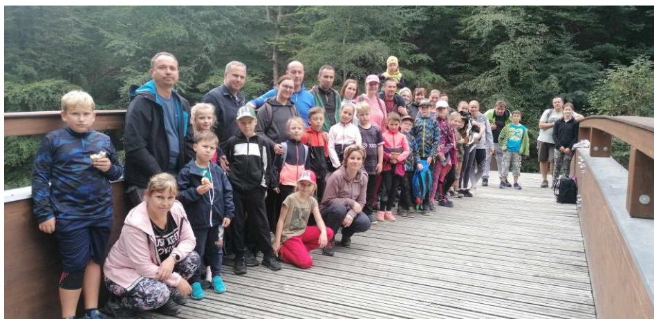
Školáci a jejich rodiče na mostě přes řeku Oslavu