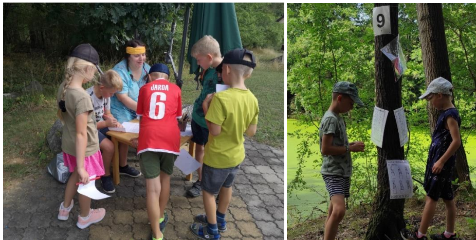
Indiánské odpoledne si děti v Kozlancech užily

V sobotu 2. září si děti užily indiánské odpoledne. V duchu indiánů se totiž letos nesl dětský den. Děti krotily divokého mustanga, poznávaly bylinky indiánské šamanky, nebo luštily indiánskou šifru. Na závěr si vyrobily malý totem. Největší atrakcí dětského dne byl ale skákací hrad, na kterém děti strávily nejvíce času. Počasí nám přálo a podle ohlasů si děti indiánské odpoledne užily.