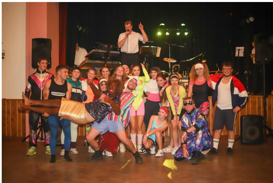
Obě taneční vystoupení na Svatomartinské zábavě sklidila zasloužený úspěch