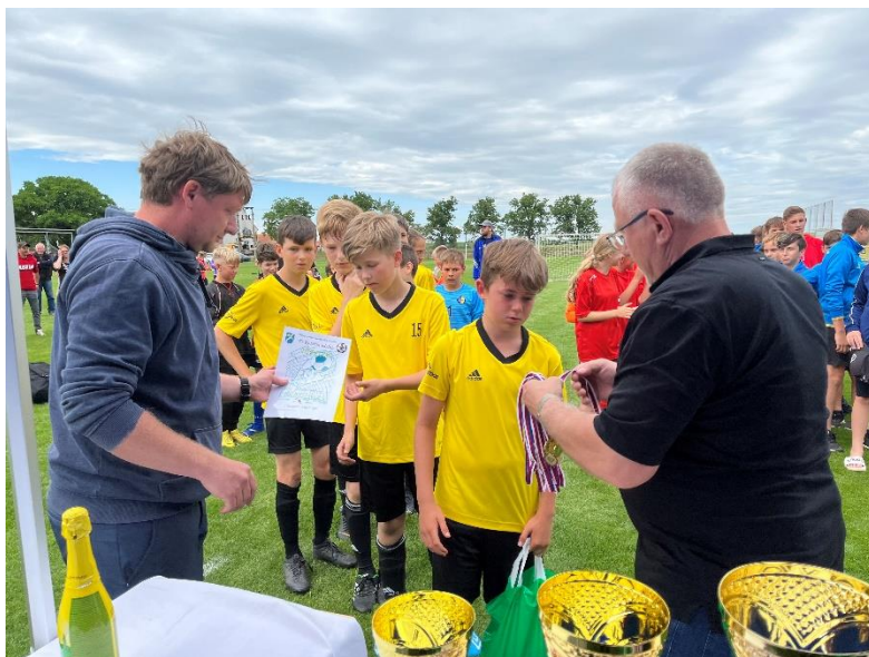
Fotbalový turnaj O pohár starosty obce měl letos rekordní účast