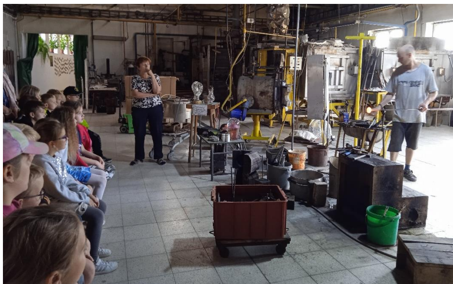
Výlet do sklárny Karlov byl pro školáky i předškoláky velký zážitek