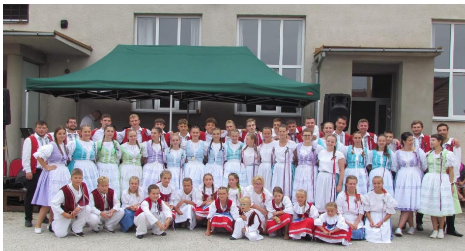
Krojovaná chasa byla na letošní pouti velmi početná