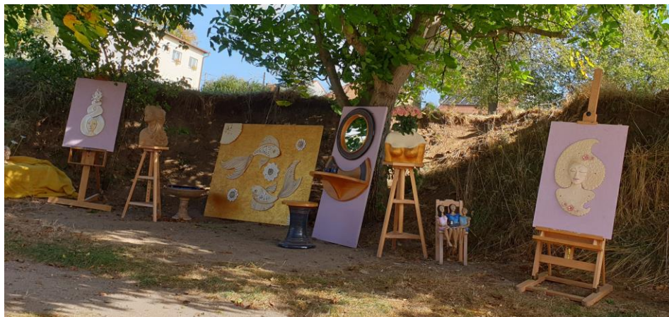
Otevřený keramický ateliér pod širým nebem