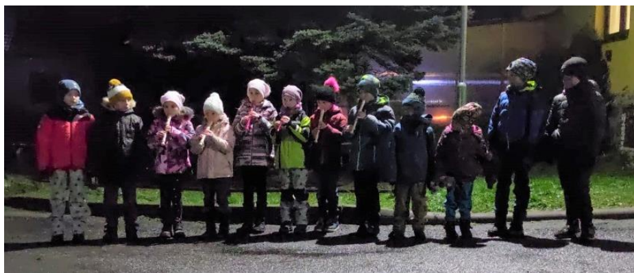
Rozsvěcení vánočního stromu

Závěr roku 2022 patřil adventním akcím. V sobotu 3. prosince jsme společně za doprovodu zpěvu vánočních koled v podání kozlanských dětí rozsvítili vánoční strom a za dětmi přišel Mikuláš.