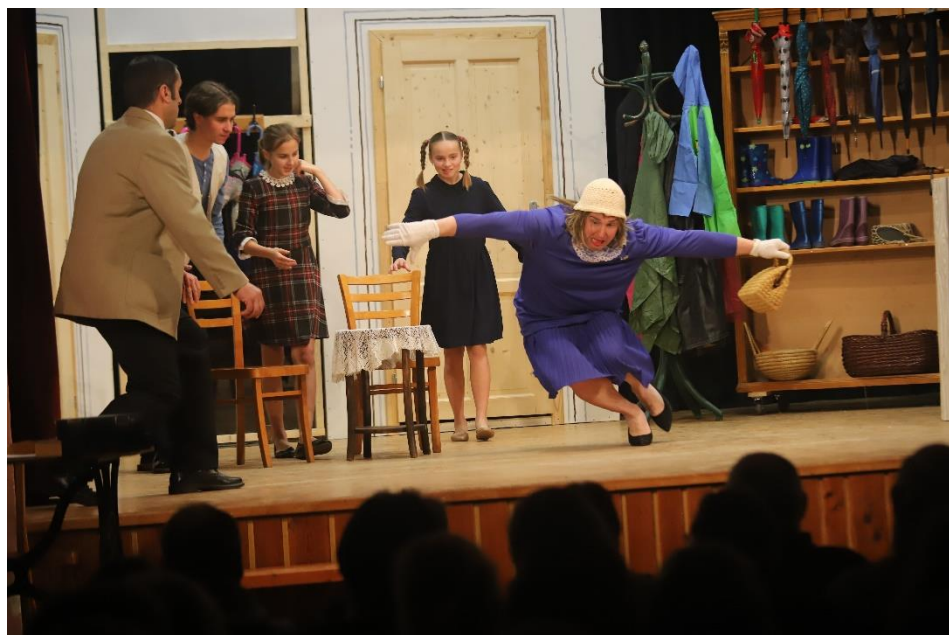
"Babička v trenkách" pobavila v pěti reprízách více než 1200 diváků

Více fotografií z letošního představení si můžete prohlédnout na webových stránkách obce https://www.obeckonesin.cz/novinky/fotogalerie/fotogalerie-roku-2023/