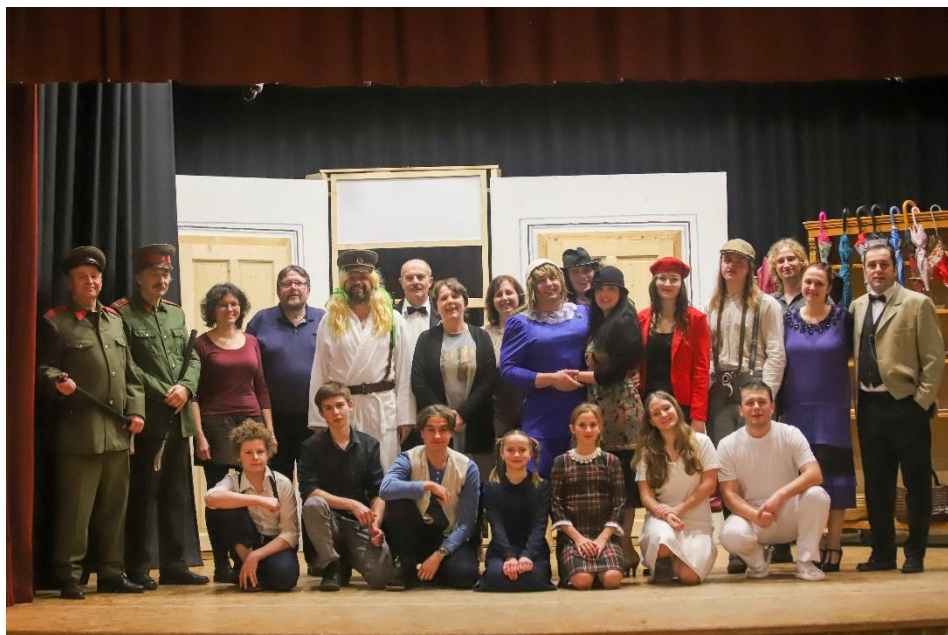
Na přípravě letošního představení se podílel velký počet ochotnických herců, hudebníků a dalších nadšenců

Koněšínský ochotnický spolek a pěvecký sbor Klokočí