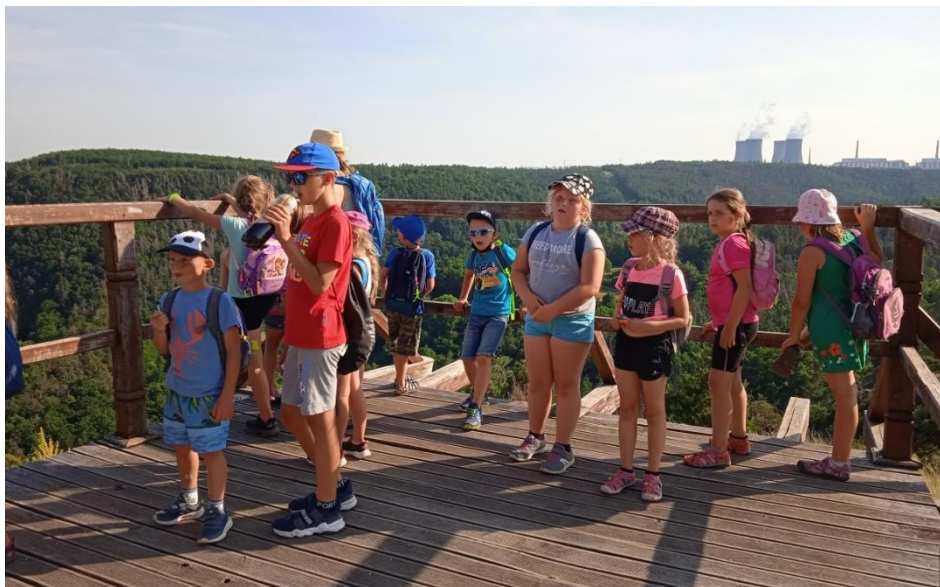
Výlet na Mohelenskou step

Druhý den jsme měli blok různých her, kdy děti soutěžily ve skupinách. Následovala sladká odměna, po obědě koupání v řece a odjezd domů.