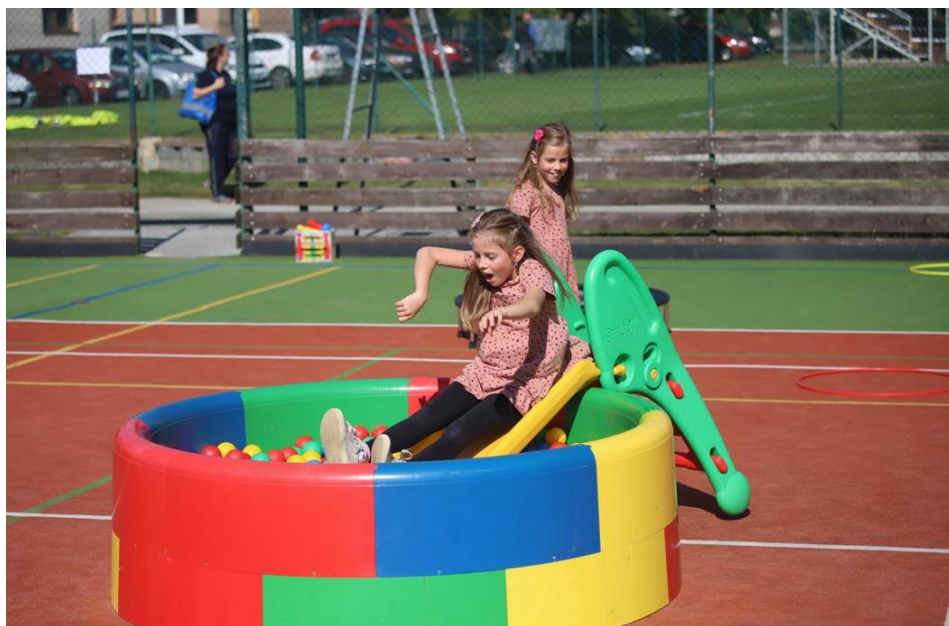
Hry pro děti jakéhokoliv věku zajistila ZŠ a MŠ Koněšín.