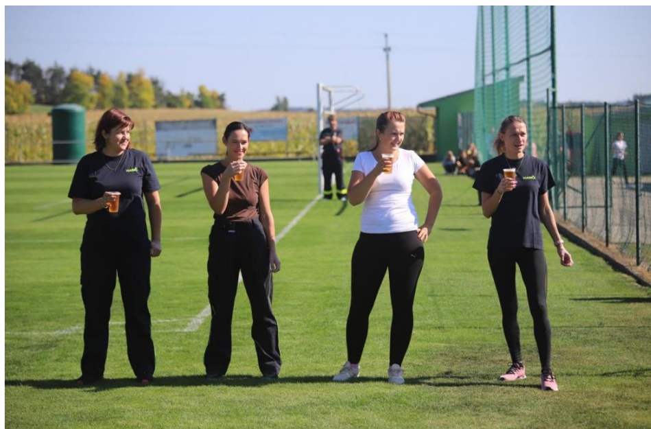
Členky ženského týmu Svazu dobrovolných hasičů předvedly, že umí hasit nejenom žízeň.