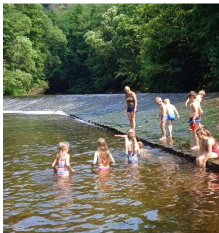
Koupání v řece