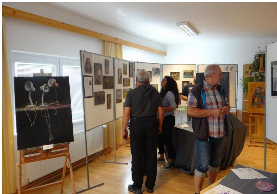
Na obecním úřadě probíhala výstava místních výtvarných umělců.