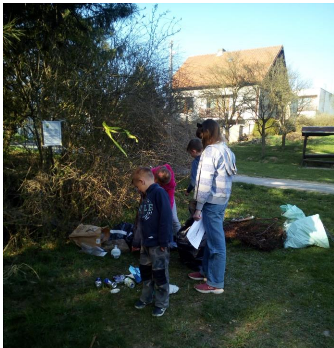
Cesta ke Dni Země