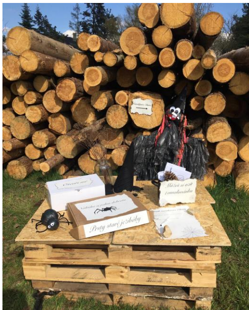
Obydlí čarodějnice Elvíry