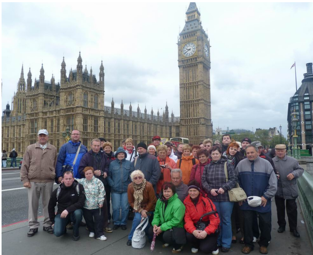
Společné foto před parlamentem v Londýně