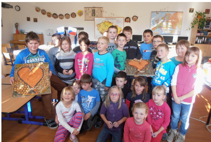
Tvoření v ZŠ Dolní Vilémovice