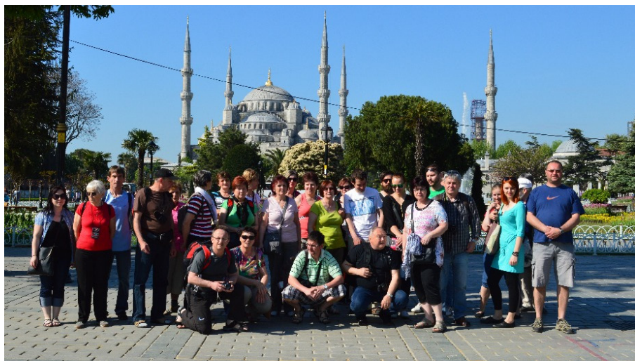
Farní zájezd do Turecka - společné foto z Istanbulu

P.S. Také si Vás dovoluji pozvat nejen na slavnostní bohoslužby o vánočních svátcích v našem koněšínském kostele, ale i na Živý Betlém, který bude ve Valči před kostelem na Boží hod vánoční (25.12) v 17 hodin. Všichni jste srdečně zváni!