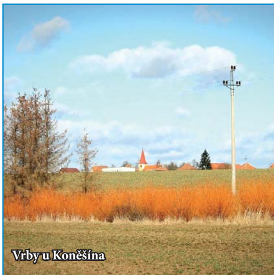
Vrby u Koněšína