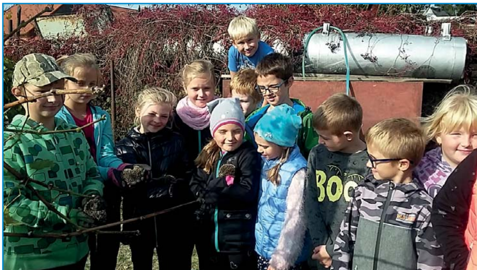
Návštěva u ježečků