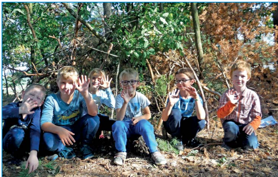
Stavba bunkru v lese