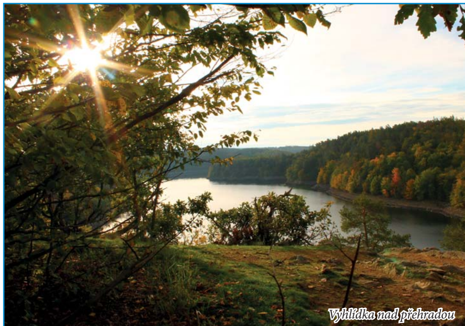
Vyhlička nad přehradou