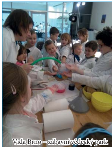
Vida Brno – zábavní vědecký park