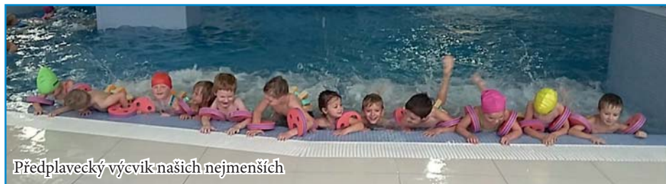
Předplavecký výcvik našich nejmenších