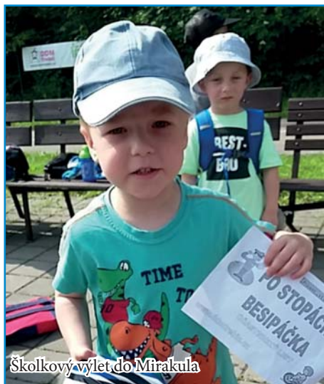
Školkový výlet do Mirakula