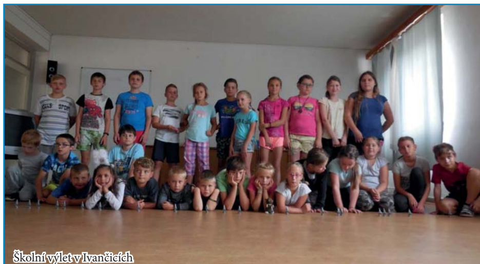
Školní výlet v Ivančicích