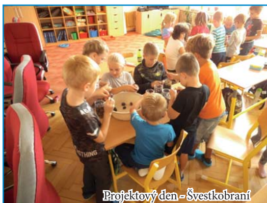
Projektový den - Švestkobraní