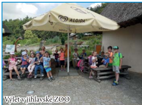
Výlet v jihlavské ZOO