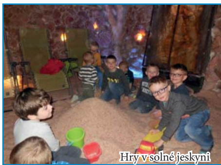
Hry v solné jeskyni