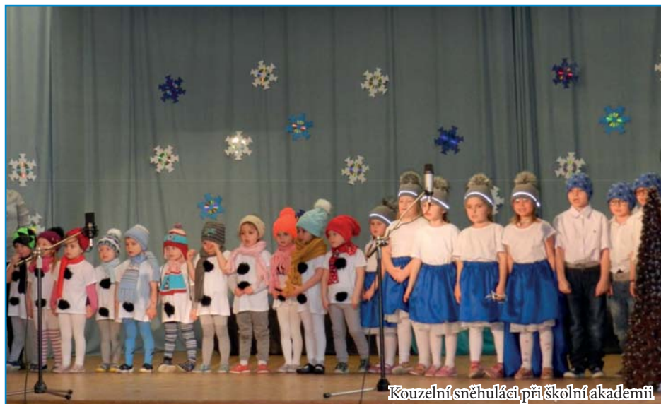
Kouzelní sněhuláci při školní akademii