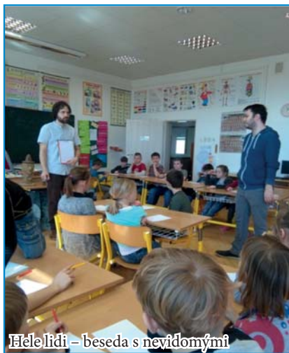
Héle lidi – beseda s nevidomými