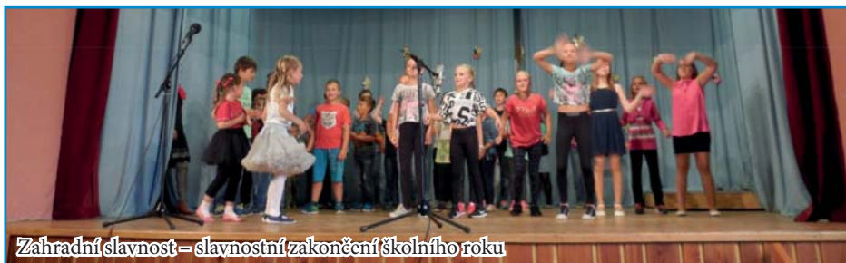
Zahradní slavnost – slavnostní zakončení školního roku

Klidný adventní čas, Vánoce plné lásky a pohody, v novém roce pevně zdraví přejí pracovníci, žáci a děti školy Konešín