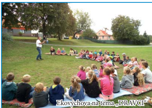
Ekovýchova na téma „DRAVCI“