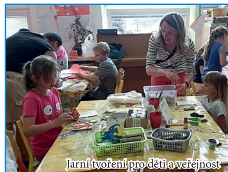
Jarní tvoření pro děti a veřejnost