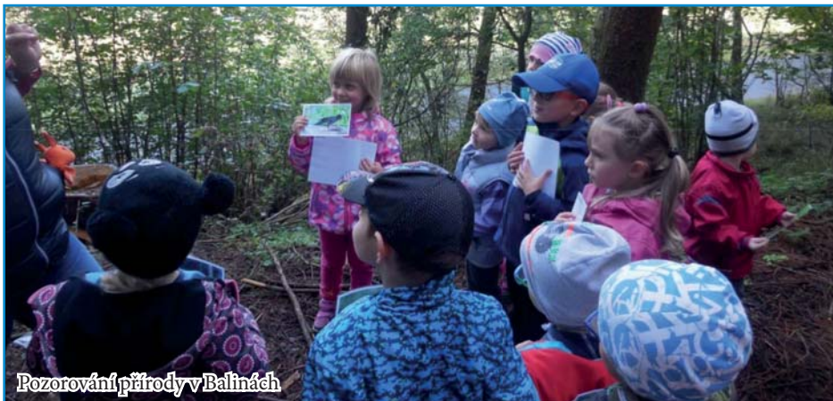
Pozorování přírody v Balínách