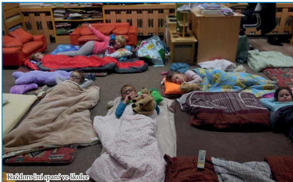
Každoroční spaní ve školce