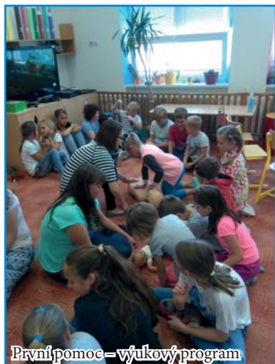
První pomoc – výukový program