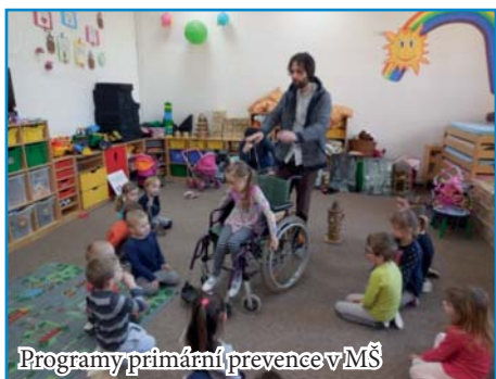
Programy primární prevence v MŠ