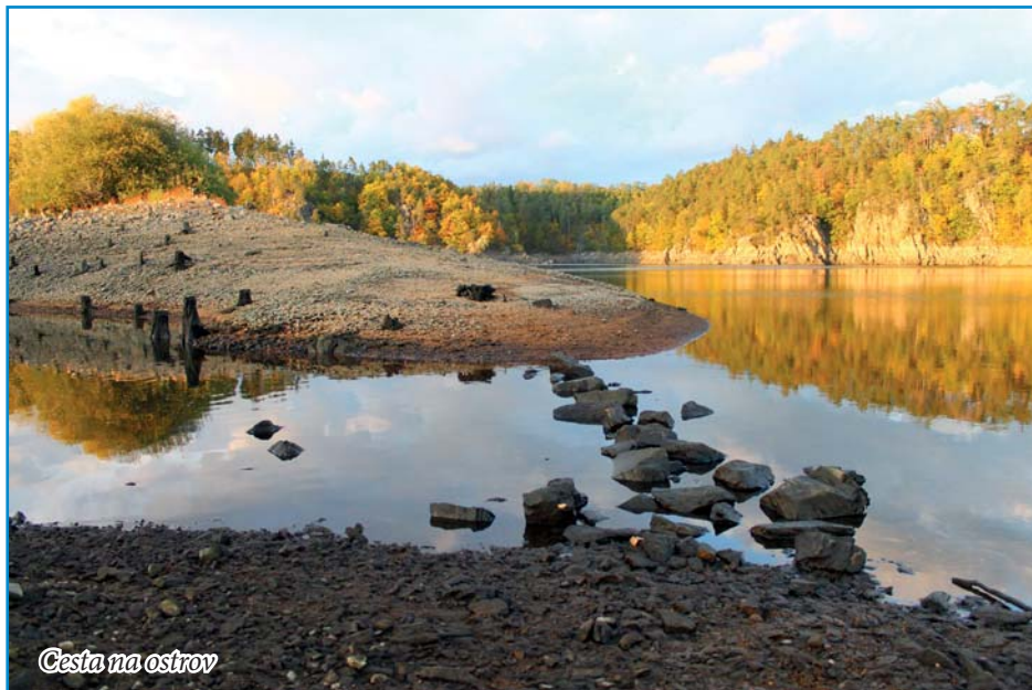
Cesta na ostrov