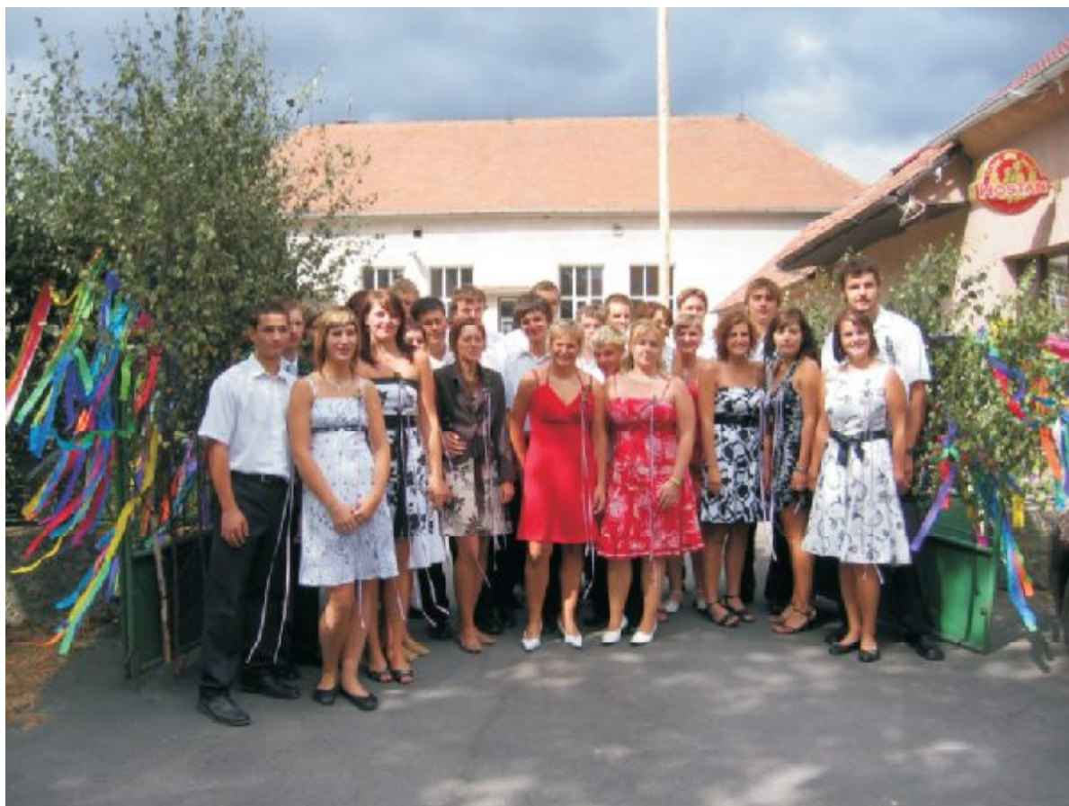
Bartolomějská pouť 2008