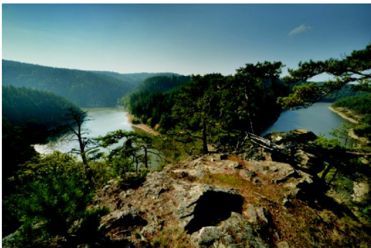
Pohled na přehradu z Halířky