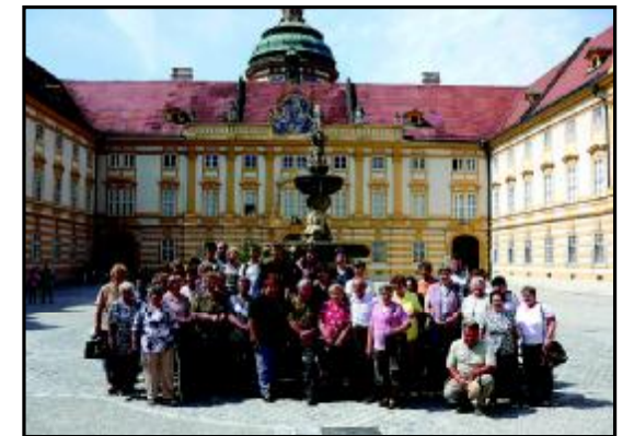
Pouť farností do Rakouska - benediktinský klášter Melk