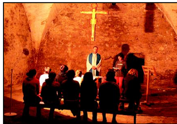
Krypta premostrantského kláštera ve Schleaglu - večerní mše sv. s mladými

V půlce února proběhl v Kulturním domě v Koněšíně již tradiční dětský karneval, který pořádala mládež z farnosti a oddíl Kolibříků.