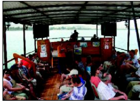
Pouť farností do Izraele - plavba po Genezaretském jezeře

Opět se blíží vánoční svátky a s nimi také konec roku 2007. Jsou to chvíle, kdy se na jednu stranu těšíme na svátky a na stranu druhou bilancujeme a hodnotíme, jaký ten uplynulý rok byl.