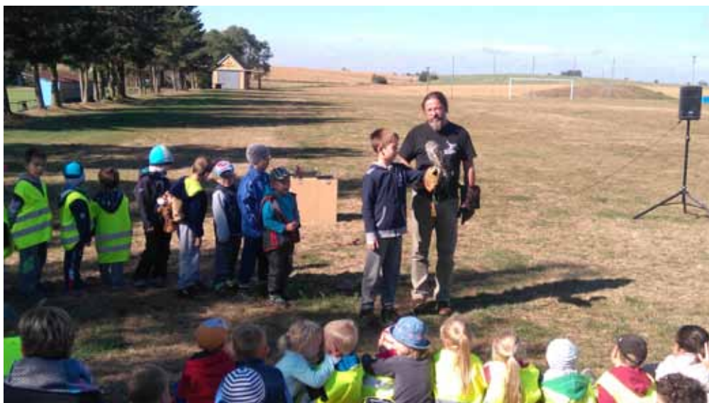
Ukázka dravců ve Studenci