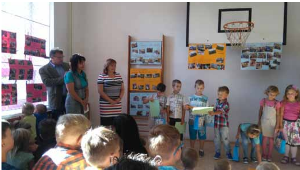
Slavnostní zahájení školního roku 2016/2017