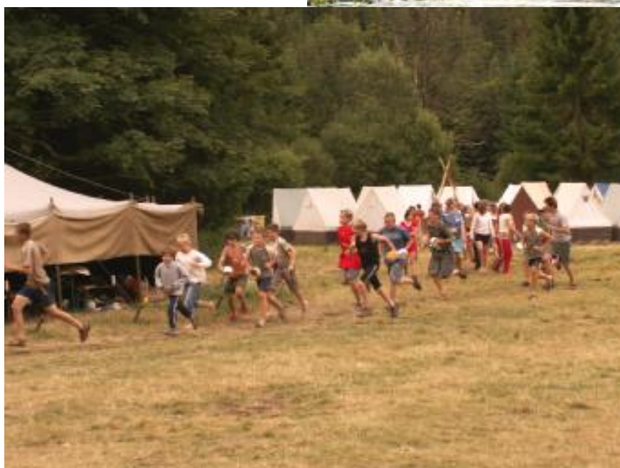
Letní farní tábor – nástup na oběd