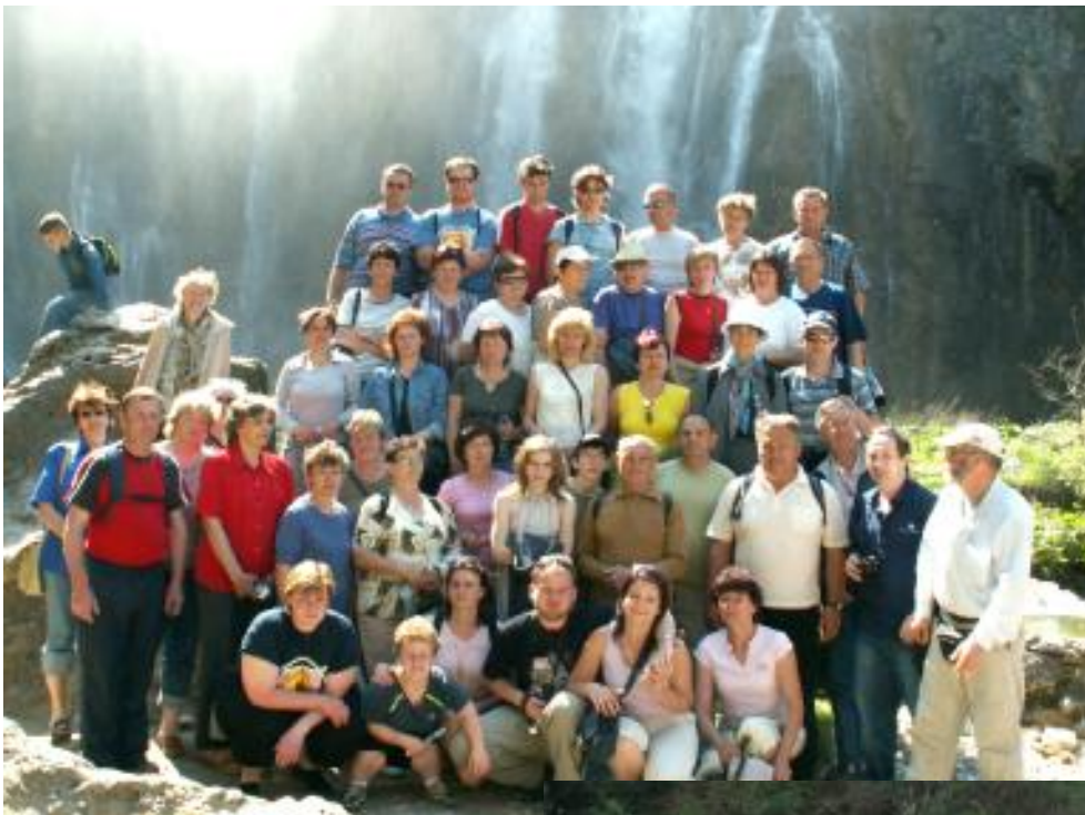
Farní zájezd do Chorvatska – Plitvická jezera