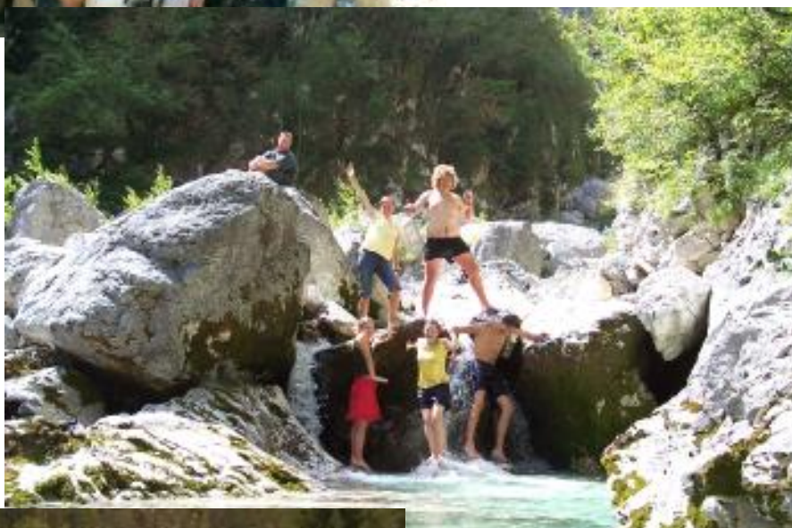
Mládež u řeky Soči v Jůlských Alpách – srpen 2006