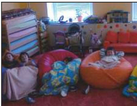
Hrajeme si i odpočíváme