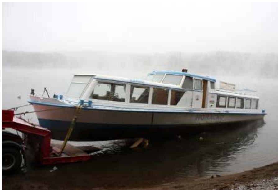
Lod' Horácko při spouštění na Dalešickou přehradu v obci Kramolín dne 21. 11. 2011.