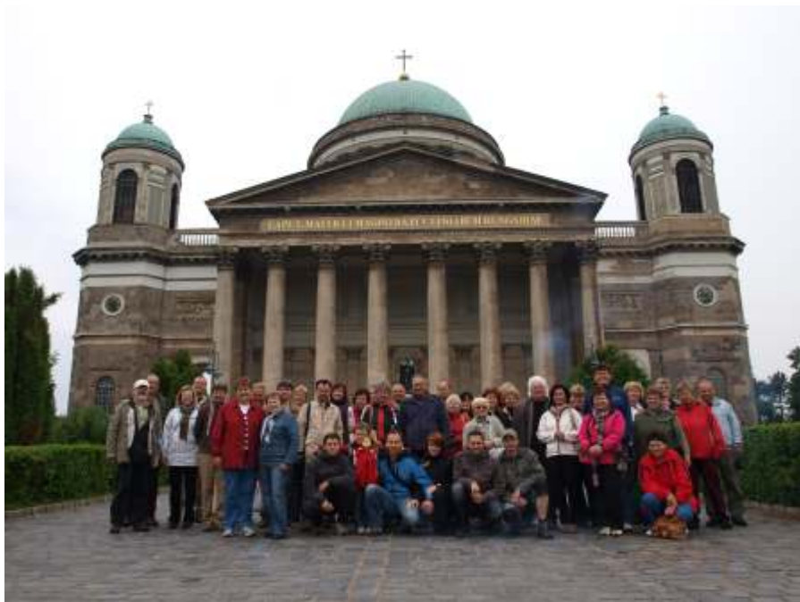
Společné foto při cestě na Ukrajinu.

ZŠ a MŠ Koněšín srdečně zve všechny rodiče a děti na