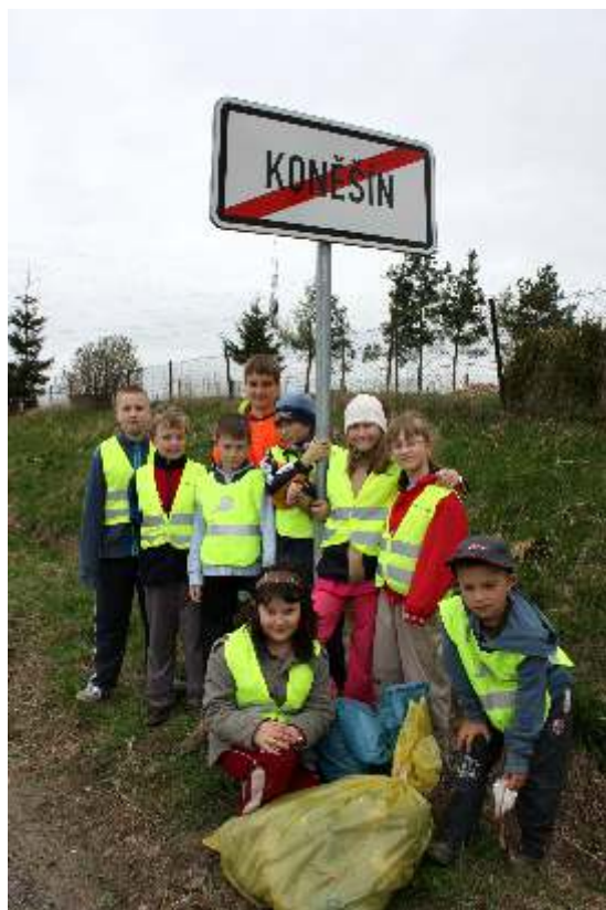
Děti ze základní školy při jarním úklidu, projekt Čistá Vysočina.