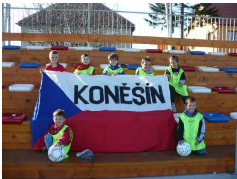
Nejmladší fotbalisté Koněšína