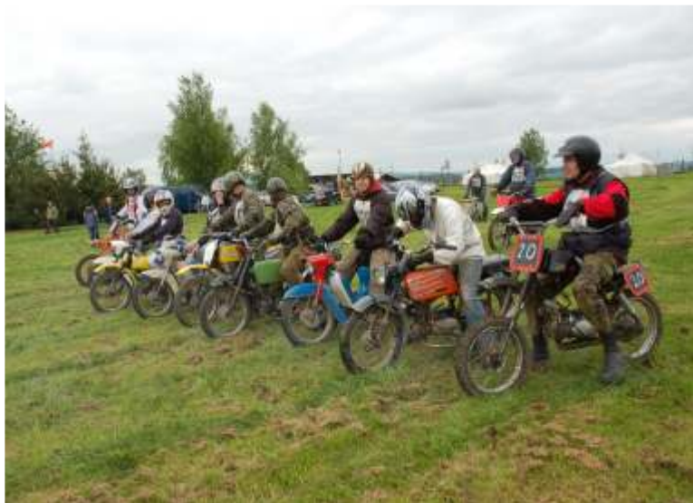
Fechtl Cup na Radarce