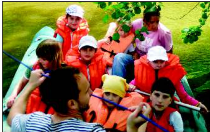
Děkanské setkání ministrantů a dětí v Přebyslavicích

Nejzápadnější místo v Evropě na břehu Atlantského oceánu – Cabo da Roca