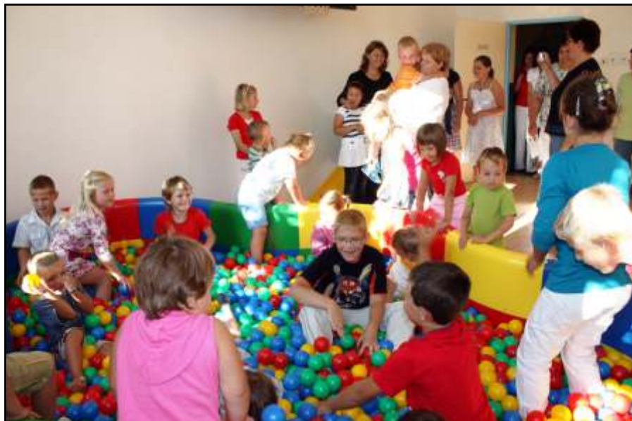
Zahájení školního roku.