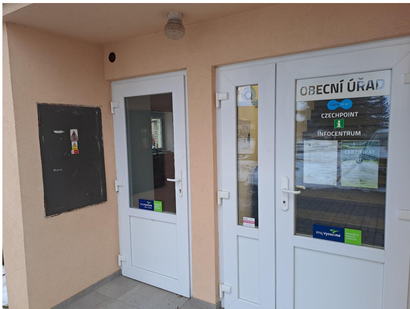
Foto č. 1 – Publicita – Sponzorský vzkaz umístěný na dveřích do klubovny